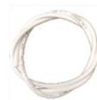
Tuyau de raccordement à connexion rapide