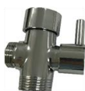
Robinet 3 Voies